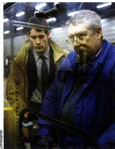
Père et fils dans le film Ressources humaines .

La probabilité de devenir cadre moyen ou supérieur s'est logiquement accrue. Comme l'a noté le sociologue Eric Maurin (1), parmi les actifs occupés issus du monde ouvrier et sortis de l'école