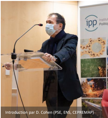
Introduction par D. Cohen (PSE, ENS, CEPREMAP)

Retrouvez tous les résultats de l'évaluation du budget 2022 directement sur le site de l'IPP – slides présentés et replays - ou en suivant les liens ci-dessous.