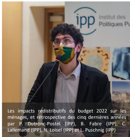
Les impacts redistributifs du budget 2022 sur les ménages, et rétrospective des cinq dernières années par P. Dutronc-Postel (IPP), B. Fabre (IPP), C. Lallemand (IPP), N. Loisel (IPP) et L. Puschnig (IPP)