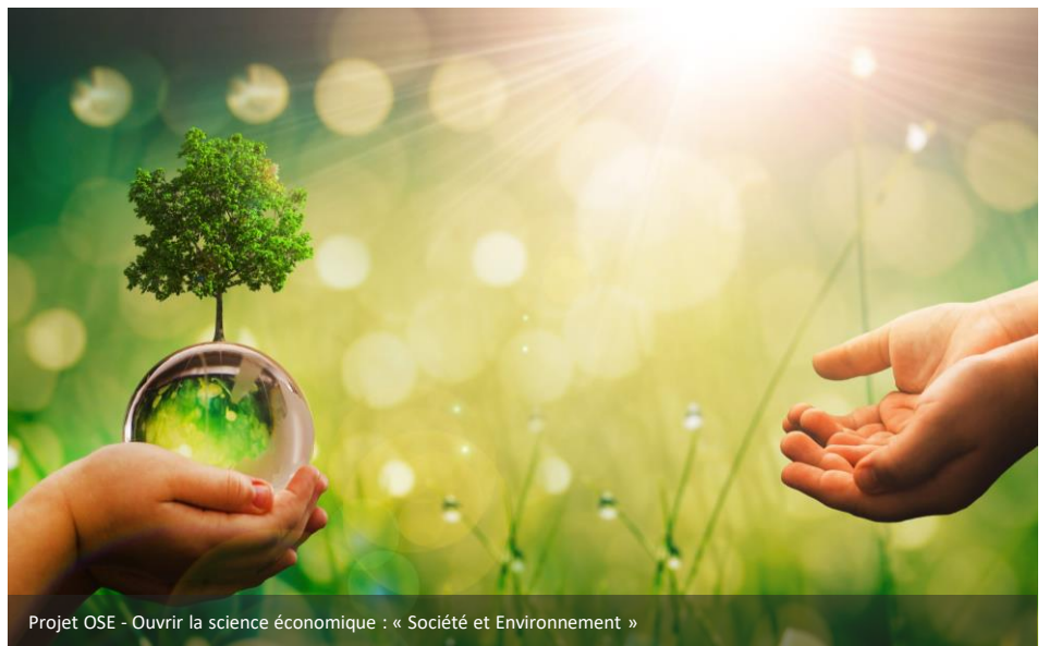
Projet OSE - Ouvrir la science économique : « Société et Environnement »

Les chercheurs de PSE s'ouvrent aux sciences naturelles ! Les défis environnementaux tels que le changement climatique, la perte massive de biodiversité, l'érosion des sols ou les pollutions constituent des risques systémiques pour nos sociétés. Les sciences sociales en général, et l'économie en particulier, ont un rôle majeur à jouer : face à ces problématiques multidimensionnelles, le développement d'une réflexion pertinente, voire la proposition de politiques publiques innovantes et appropriées, n'est possible qu'en ouvrant les sciences sociales aux sciences naturelles. L'objectif du projet « Société et Environnement » est de construire des ponts entre ces deux disciplines pour accroître la pertinence scientifique des travaux menés à PSE et être en mesure de fournir des réponses aux demandes de la société civile quant à des analyses utiles et multidisciplinaires.