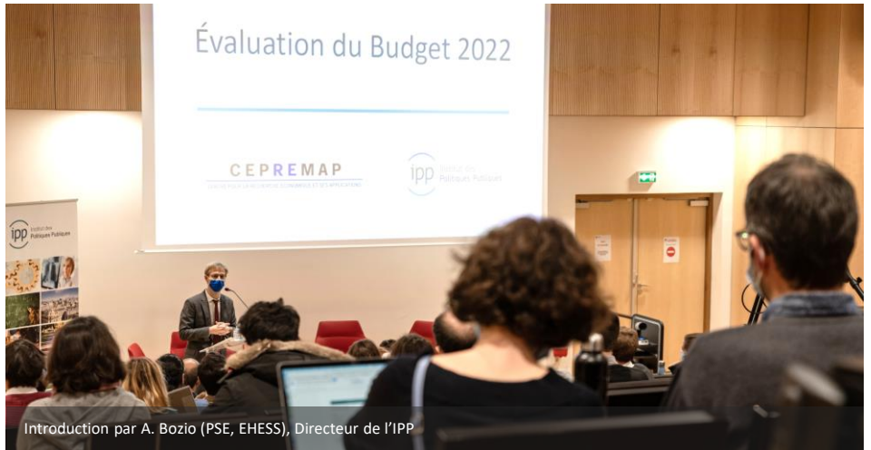
Introduction par A. Bozio (PSE, EHESS), Directeur de l'IPP